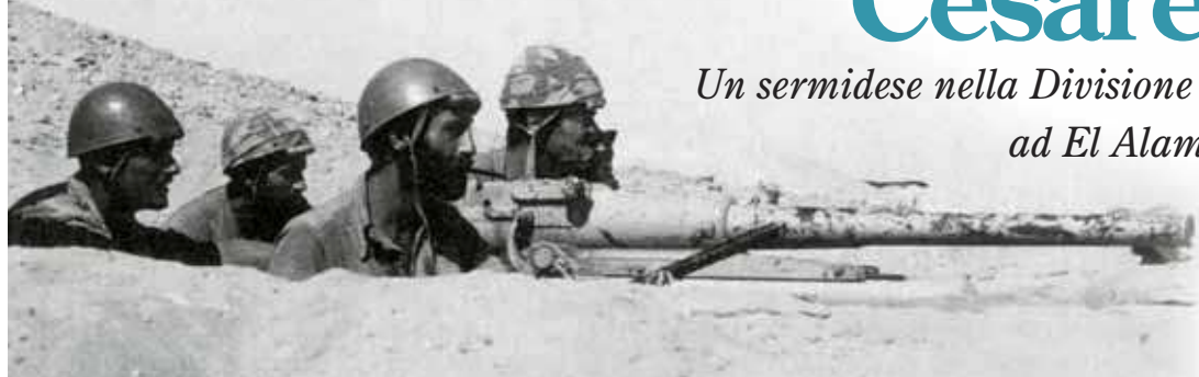
Una postazione controcarro nel settore della Divisione Paracadutisti Folgore a El Alamein

Un sermidese nella Divisione Paracadutisti Folgore ad El Alamein