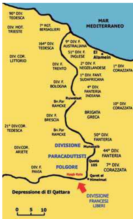
Disposizione dei reparti all'inizio della Battaglia di El Alamein il 23 Ottobre 1942