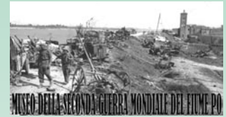
MUSEO DELLA SECONDA GUERRA MONDIALE DEL FIUME PO