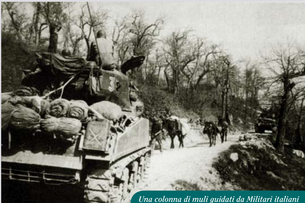
Una colonna di muli guidati da Militari italiani incrocia veicoli corazzati statunitensi

termine del conflitto, si trovarono nell'obbligo di ordinare la dismissione dei muli una volta giunti sul fiume Po. Come luogo logico dove riunire tutti i muli fu scelto il Centro Addestramento Quadrupedi del Regio Esercito a San Martino Spino. In tale luogo confluirono tutti gli animali radunati nei centri di concentrazione equini predisposti provvisoriamente in vari luoghi a sud del grande fiume. In territorio di Sermide il centro di concentrazione di muli e personale salmerie fu