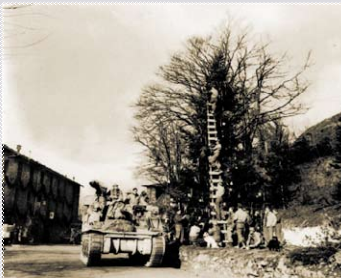
Militari statunitensi della 91st Infantry Division addobbano un abete nelle retrovie del fronte

La 91ª Divisione di Fanteria statunitense (91st US Infantry Division), la quale il 24 Aprile 1945 giunse a Sermide, passò gran parte dell'Inverno 1944-'45 e quindi anche il Natale nella zona tra Livergnano di Pianoro, Loiano e Monghidoro sull'Appennino bolognese. Ligi alle tradizioni e dotati di notevoli quantità di rifornimenti, come tutti i reparti statunitensi, anche i militari della 91ª Divisione poterono sbizzarrirsi negli addobbi natalizi nella zona delle retrovie del fronte.